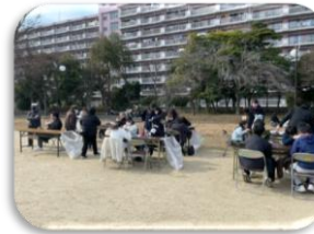
ウインターフェスタ