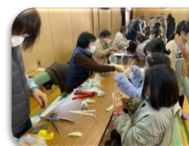
ウインターフェスタ